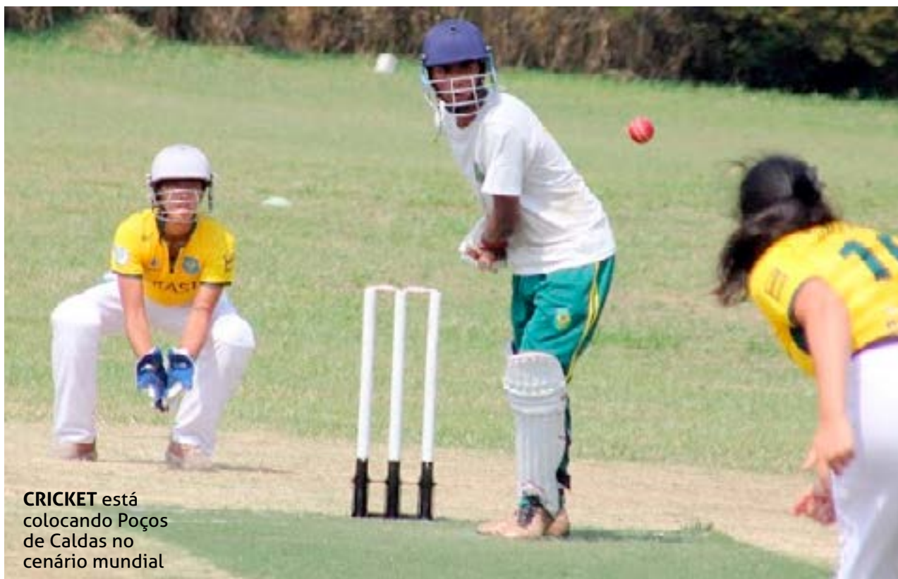
CRICKET está colocando Poços de Caldas no cenário mundial

A equipe brasileira feminina de cricket, com 15 atletas, vai disputar as eliminatórias para a Copa do Mundo, em novembro, provavelmente em Miami (USA). E o que chama a atenção é que 10 dessas atletas,