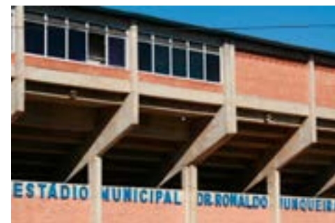
Ronaldão tem histórico de grandes jogos do futebol brasileiro

do interior e até da região, mas a história que ele possui jamais será apagada. Nomes inesquecíveis do futebol jogaram em seu gramado. Ronaldo, o grande fenômeno, jogou pela primeira vez como profissional no