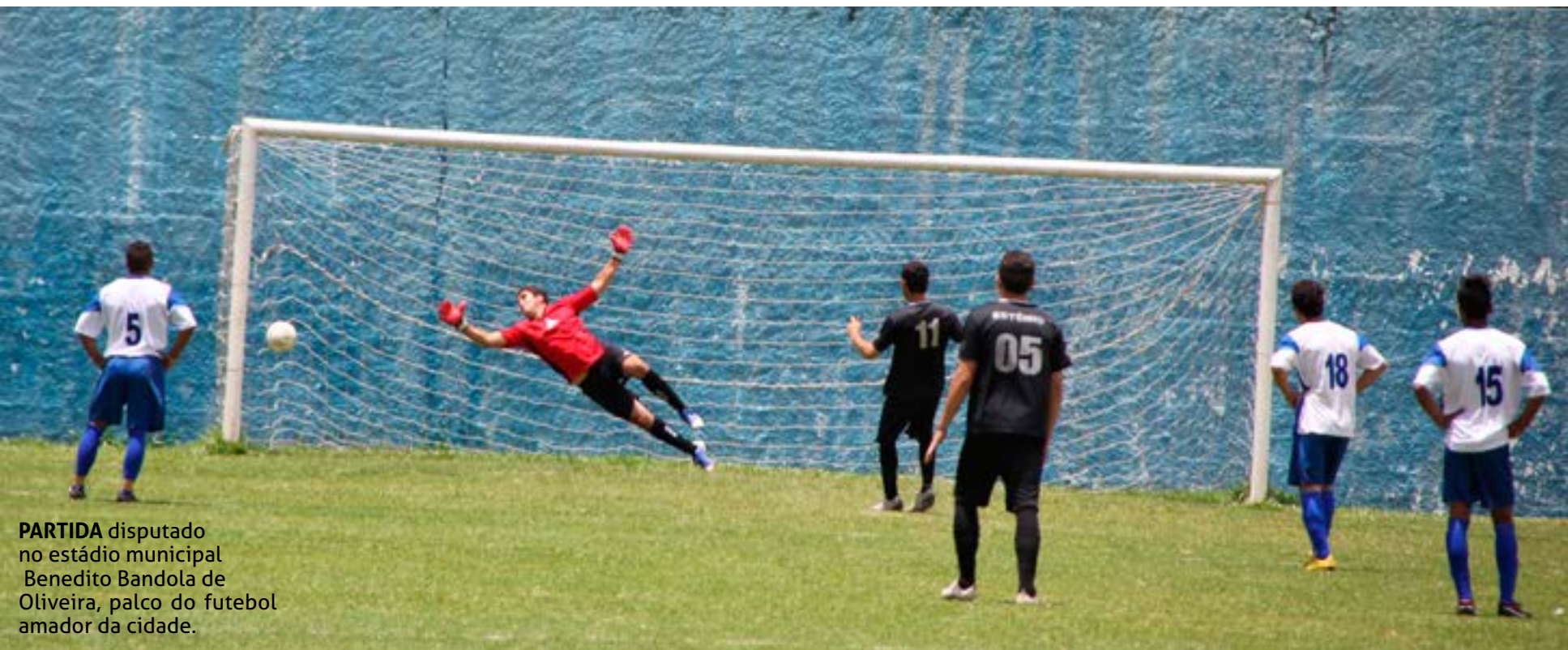
PARTIDA disputado no estádio municipal Benedito Bandola de Oliveira, palco do futebol amador da cidade.