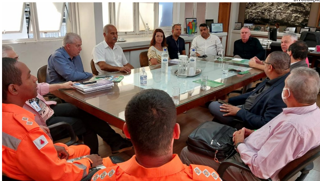
REUNIÃO no gabinete do prefeito definiu os últimos detalhes para a realização do congresso