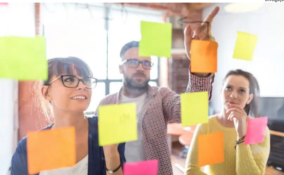
Divulgação EDITAL irá selecionar empresas de todo o país para o Desenvolvimento de Negócios Inovadores e Inovação em Territórios. Inscrições vão até 30/09

Minas Gerais - Sebrae Minas abriu edital para o credenciamento de empresas prestadoras de serviços, para atuarem com o Desenvolvimento de Negócios Inovadores e Inovação em Territórios. Empresas de todo o país podem se inscrever gratuitamente até o dia 30 de setembro, pelo site. O objetivo do edital é credenciar empresas para atuarem com soluções de inovação, visando fomentar e acelerar o crescimento de pequenos negócios inovadores, e estimular a inovação em territórios. As empresas podem se cadastrar para atuar em diferentes soluções, divididas em três temas: Inovação e Territórios; Negócios Inovadores; e Internacionalização e Capital Empreendedor. Ao todo, são 21 produtos de inovação disponíveis para credenciamento. Confira a seguir o detalhamento sobre os temas. As soluções referentes a cada tema estão detalhadas no edital. 1 – Inovação em Territórios: Reúne soluções voltadas ao desenvolvimento territorial impulsionado pela inovação, por meio do fortalecimento dos ecossistemas locais de inovação e dos ambientes