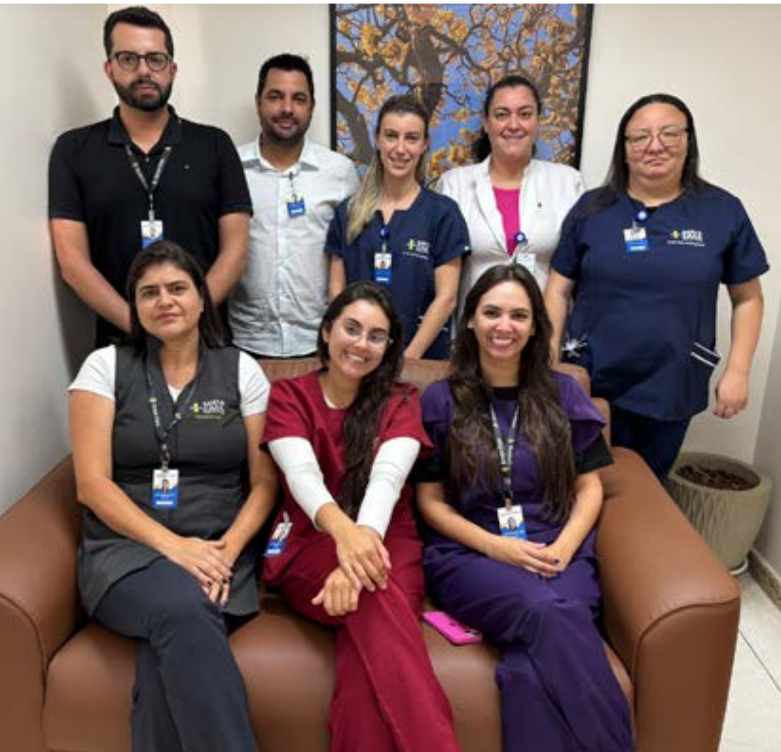
A EQUIPE multidisciplinar da Unacon da Santa Casa de Poços