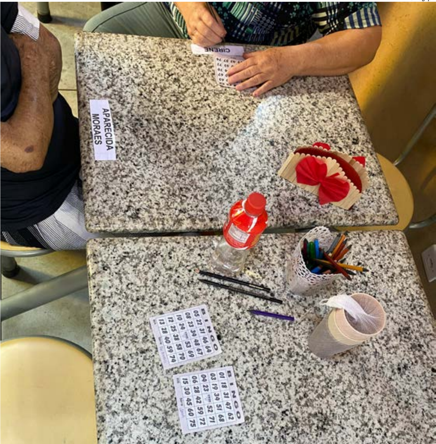
ENCONTRO reuniu os idosos atendidos pela unidade para uma atividade sobre direitos previstos no Estatuto da Pessoa Idosa

A decisão do Congresso é politicamente popular, especialmente entre um eleitorado que busca algum alívio no orçamento familiar. Mas políticas públicas precisam ir além do aplauso imediato. É necessário que o governo avance simultaneamente em programas de renovação de frota, inspeção veicular periódica e incentivo a veículos mais limpos. Caso contrário, corre-se o risco de transformar uma vitória do contribuinte em um retrocesso coletivo.