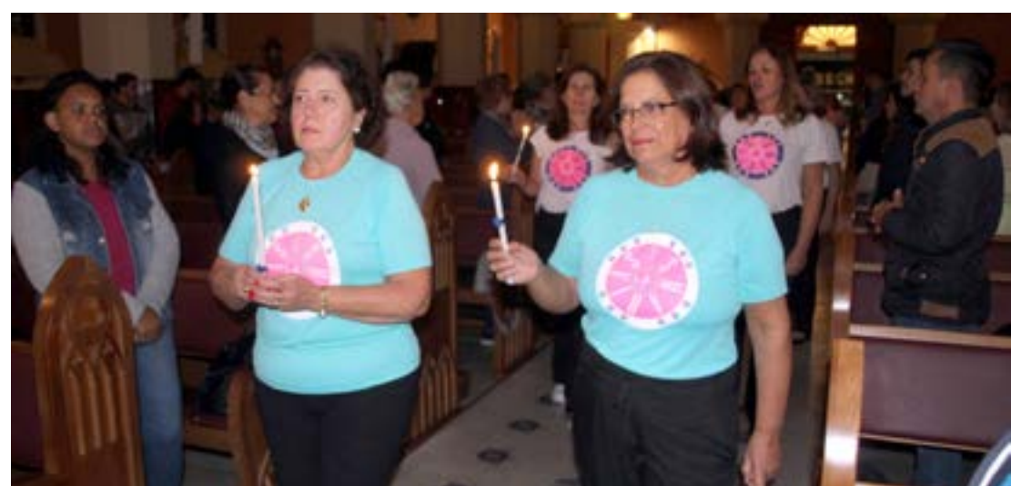
COROAÇÃO é tradicional durante todo o mês de maio