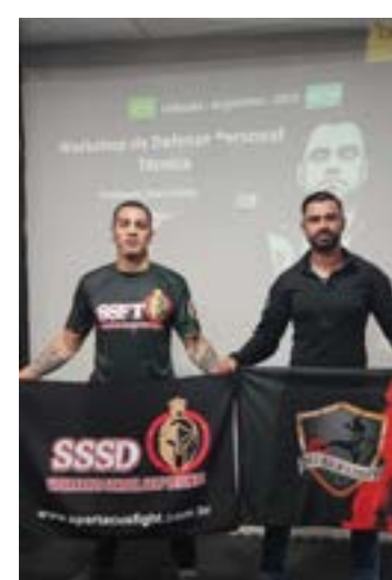
EVENTO internacional na Argentina reuniu policiais, lutadores profissionais, professores e atletas em um intercâmbio técnico de alto nível