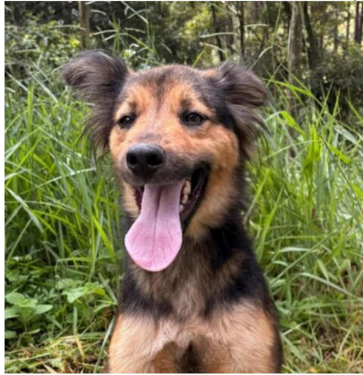
TATI é um dos animaizinhos que estarão disponíveis para adoção

Poços de Caldas, MG - A Prefeitura promove neste sábado (28), das 13h às 16h, mais uma feira de adoção de animais na Alameda Alameda Poços de Caldas. A ação reúne cães e gatos do Abrigo Municipal de Animais que aguardam a oportunidade de encontrar um novo lar.