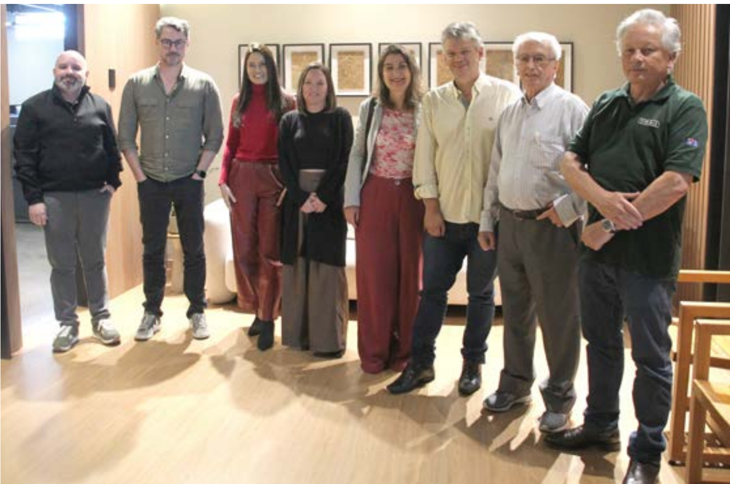
REPRESENTANTES da imprensa e da Viridis se encontraram para falar de terras raras

A expectativa da empresa é obter a Licença de Instalação até meados do segundo semestre deste ano, o que permitiria o início efetivo da fase de construção. Paralelamente, a Viridis já possui financiamentos em andamento e contratos de compra futura do produto da mina em negociação, o que reforça a viabilidade econômica do empreendimento.