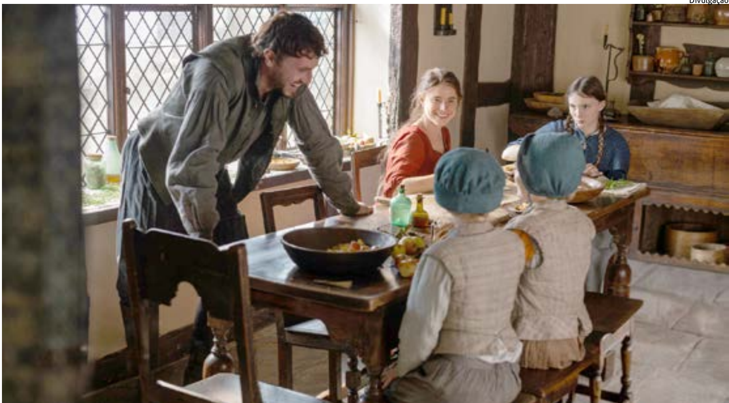
CENA de Hamnet: A vida antes de Hamlet