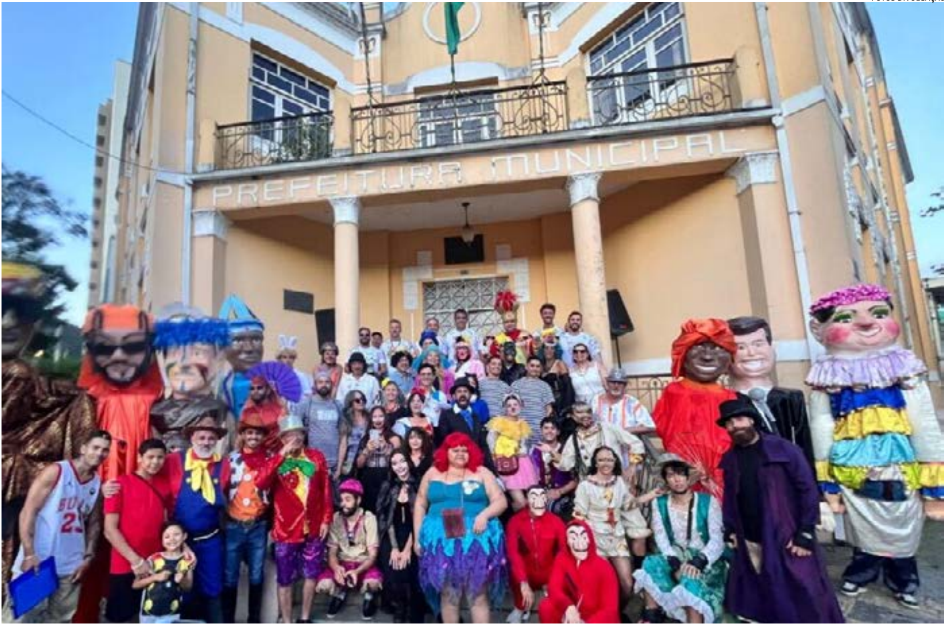
ENTREGA da chave da cidade ao Rei Momo abre oficialmente o Carnaval em Poços

Uma das figuras mais emblemáticas do Carnaval, o Rei Momo é o símbolo da irreverência na folia. A origem do nome da majestade da festa re-