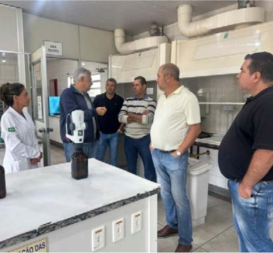
AUTORIDADES visitaram diversos setores do DMAE, entre eles, o laboratório de análises