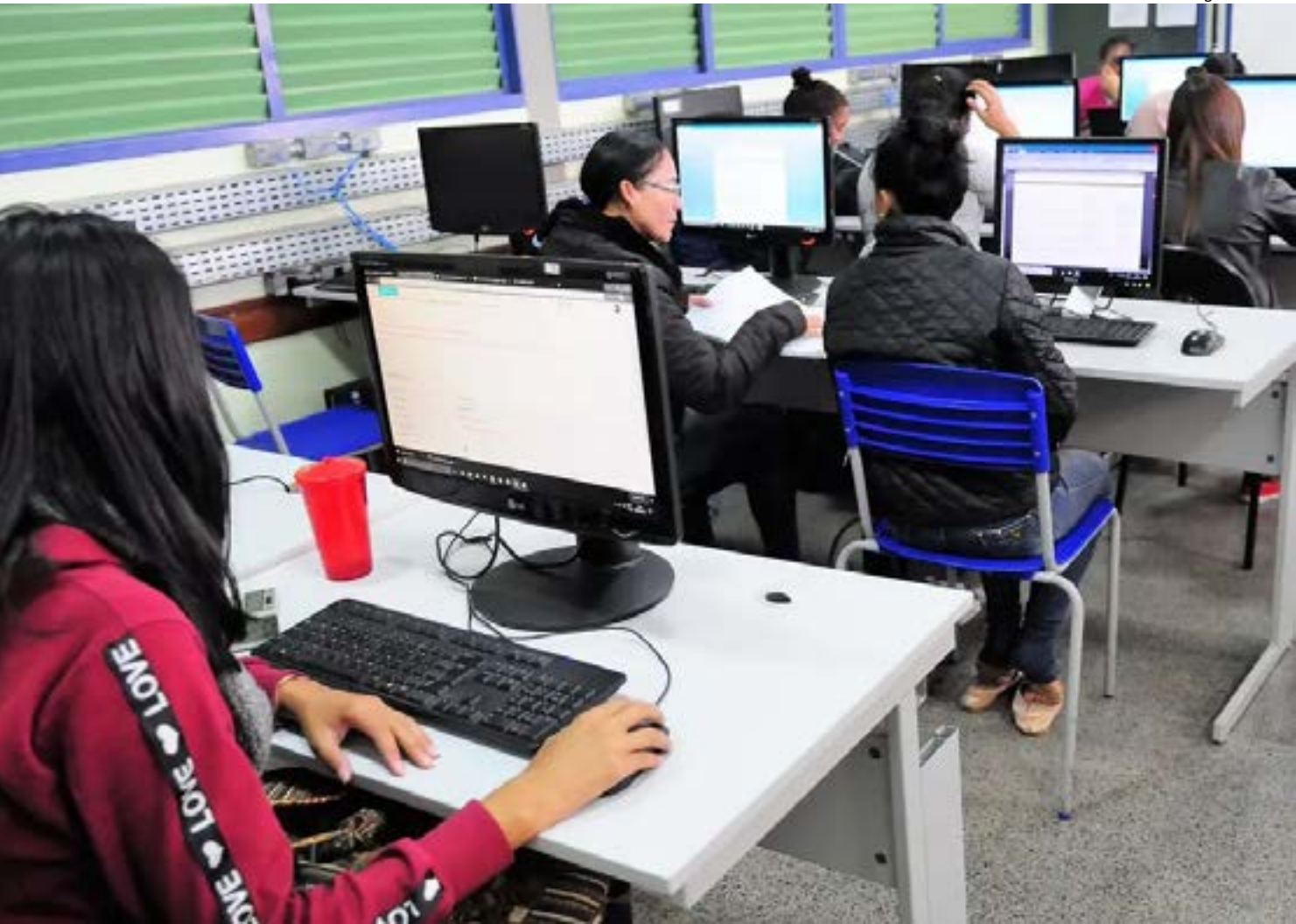
Lúcio Bernardo Jr. / Agência Brasília