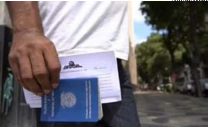
DIGITALIZAÇÃO acelerada e o surgimento de novos modelos de negócios

Rede de Notícias do Sindijori MG www.sindijorimg.com.br