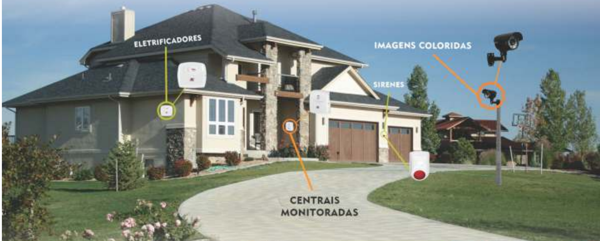
Monitoramento 24 horas