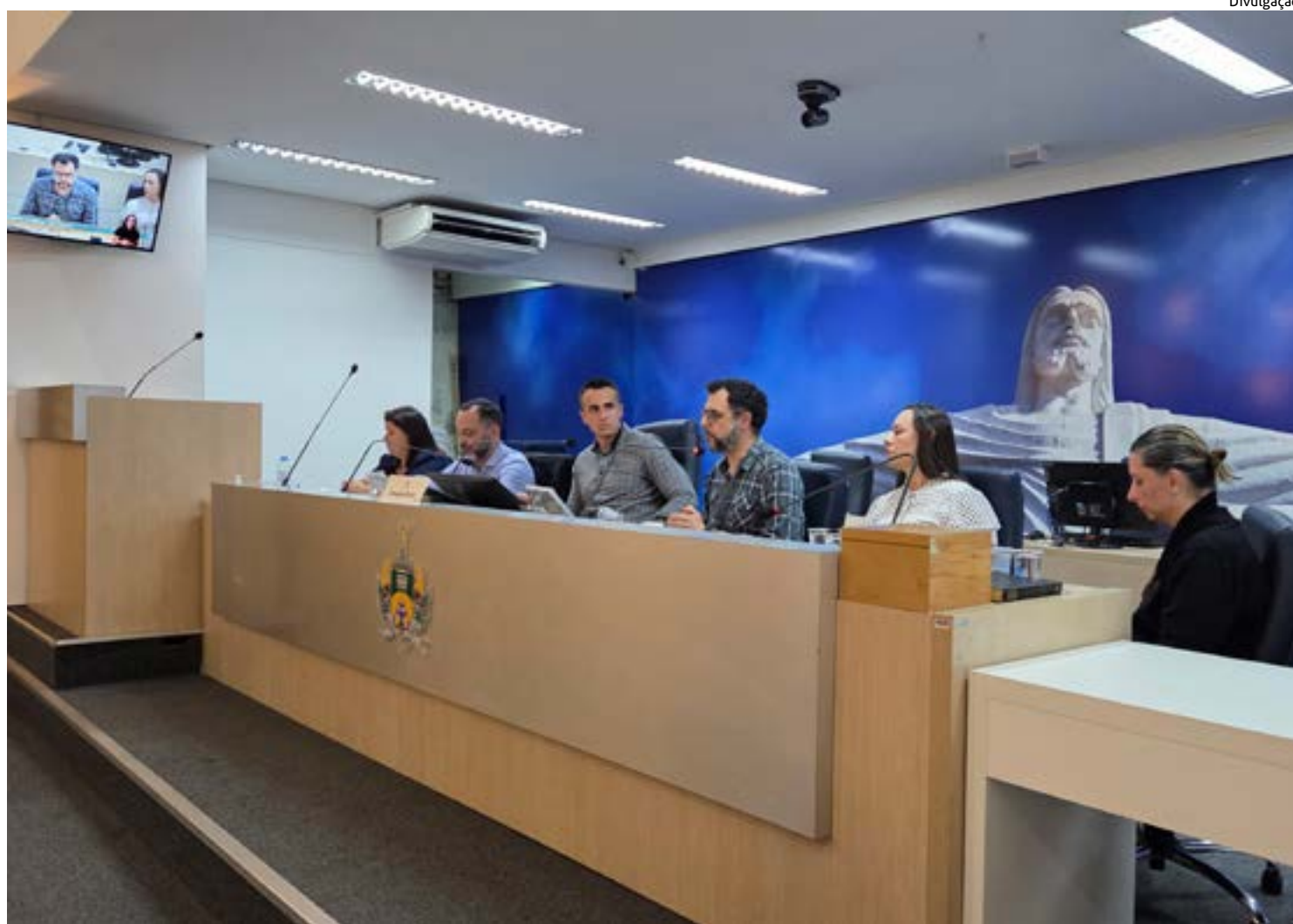
AUDIÊNCIA discutiu quatro Projetos de Lei, em análise pelas Comissões, que versam sobre proteção, inclusão e permanência de estudantes no sistema educacional

O vereador comentou sobre a motivação da proposta e o papel das escolas nesse enfrentamento. "Estou trazendo para o âmbito do município de