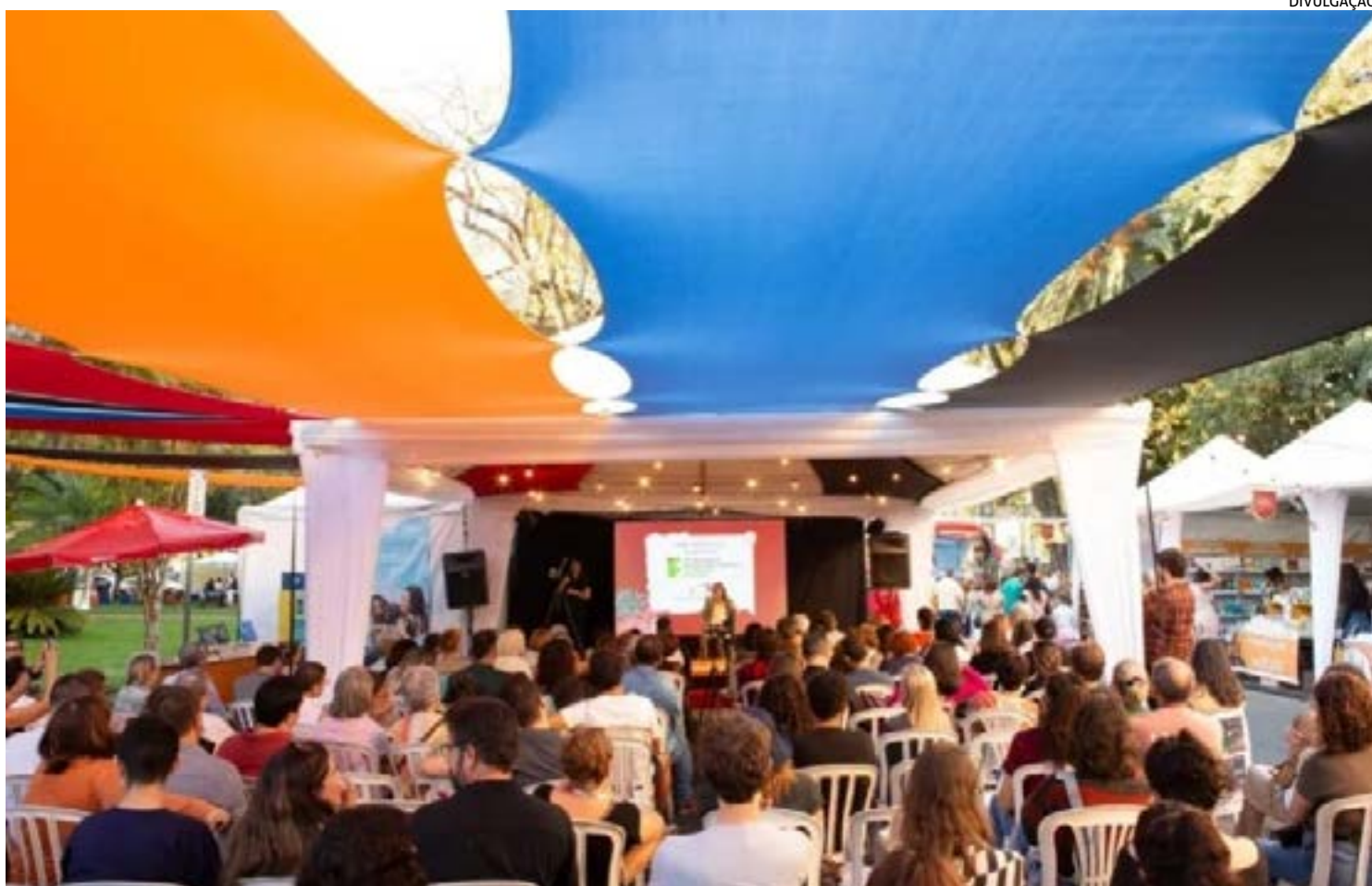
"COM O TEMA "Cartas e Diários na Literatura", festival anuncia homenageadas como Carla Madeira e Paloma Amado, fortalece ações internacionais e investe em formação de leitores."

O protagonismo feminino marca esta edição com duas grandes homenagens. A escritora Carla Madeira será a Patronesse do Festival, reconhecida pelo impacto de romances