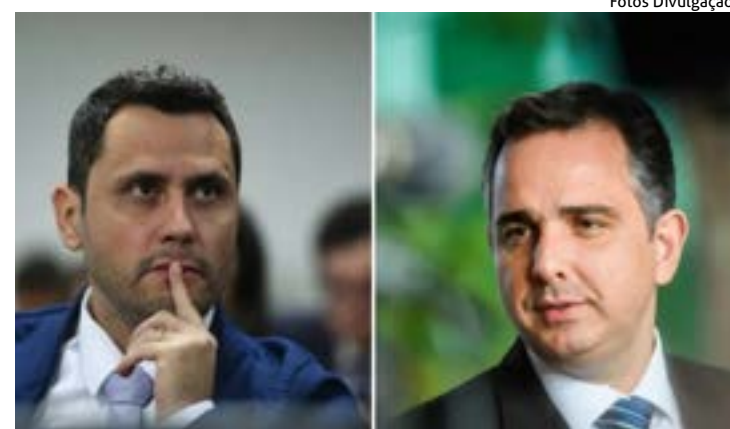
SENADORES Cleitinho Azevedo e Rodrigo Pacheco: pré-candidatos ao governo de Minas

Rede de Notícias do Sindijori MG www.sindijorimg.com.br