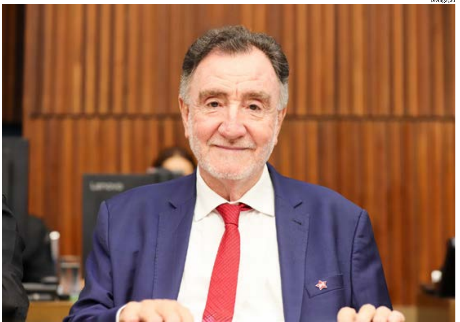
DEPUTADO FEDERAL Patrus Ananias, ex-ministro do governo do presidente Luiz Inácio Lula da Silva

Paulo Ney também destacou que a boa relação construída com o Governo de Minas tem sido fundamental para que Poços de Caldas avance em projetos importantes para a população. Segundo o prefeito, o diálogo permanente com o Estado tem possibilitado a conquista de investimentos concretos em áreas estratégicas, especialmente na saúde, fortalecendo a estrutura do município e ampliando a capacidade de atendimento regional.