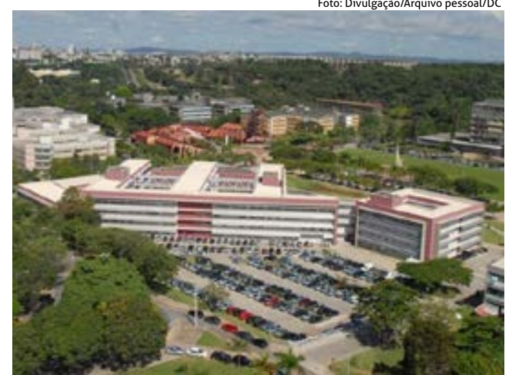
CAMPUS da UFMG na Pampulha em BH: crescimento em diferentes áreas do conhecimen