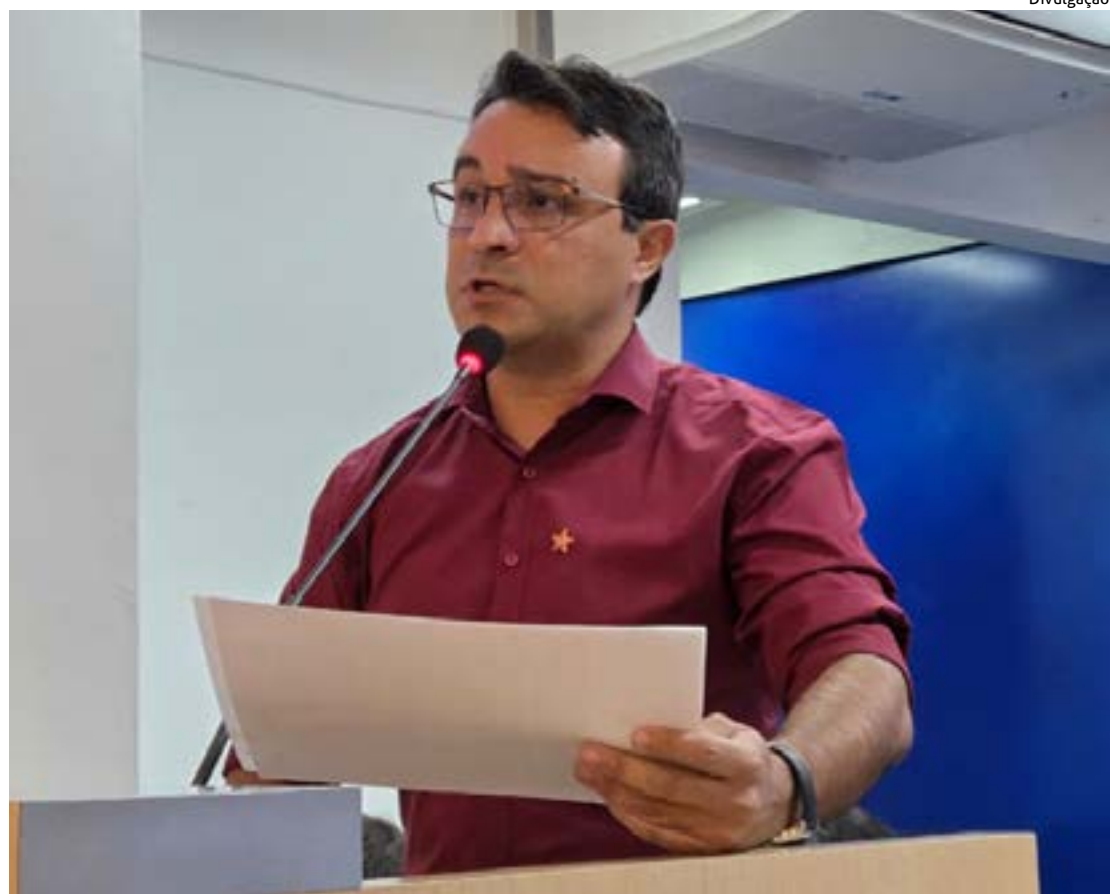
MAFRA reforça que a ideia é promover o desenvolvimento econômico local solidário sem ferir as competências constitucionais

São objetivos do projeto: estimular formas de organização econômica baseadas nos princípios da cooperação, autogestão e comércio justo; promover a geração de trabalho e renda por meio de empreendimentos econômicos solidários; incentivar o desenvolvimento susten-