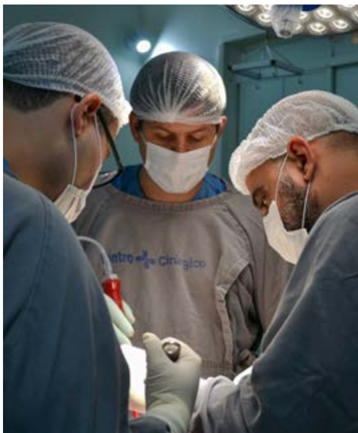
A 5ª JORNADA do Quadril veio mudar a vida de oito pacientes SUS que foram submetidos à artroplastia total de quadril