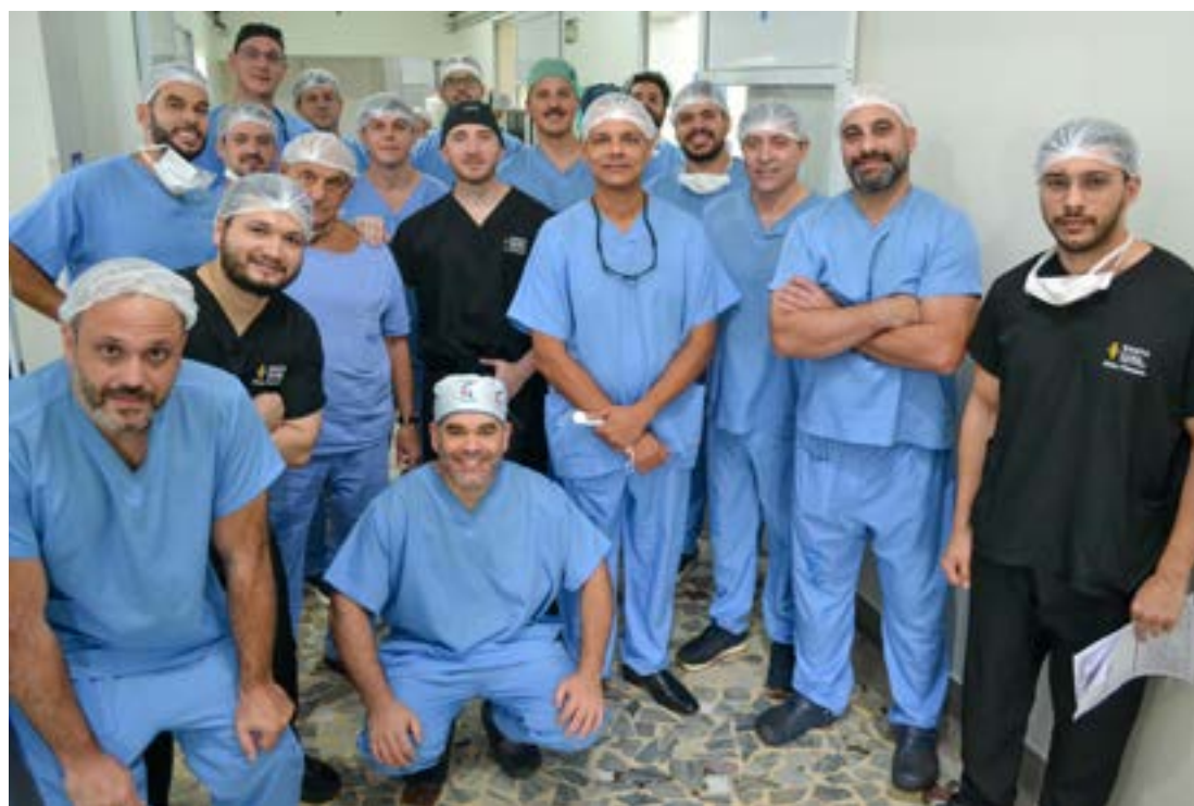
O EVENTO contou com grandes nomes da cirurgia do quadril, com profissionais de São Paulo, Paraná e Minas Gerais

O médico também ressaltou o alcance científico do evento: “Também tivemos a parte teórica com grandes nomes da cirurgia do quadril, com palestrantes de São Paulo, Belo Horizonte, Paraná e Minas Gerais. Contamos ainda com a presença do presidente da Sociedade Brasileira do Quadril e do presidente da Regional Sudeste.”