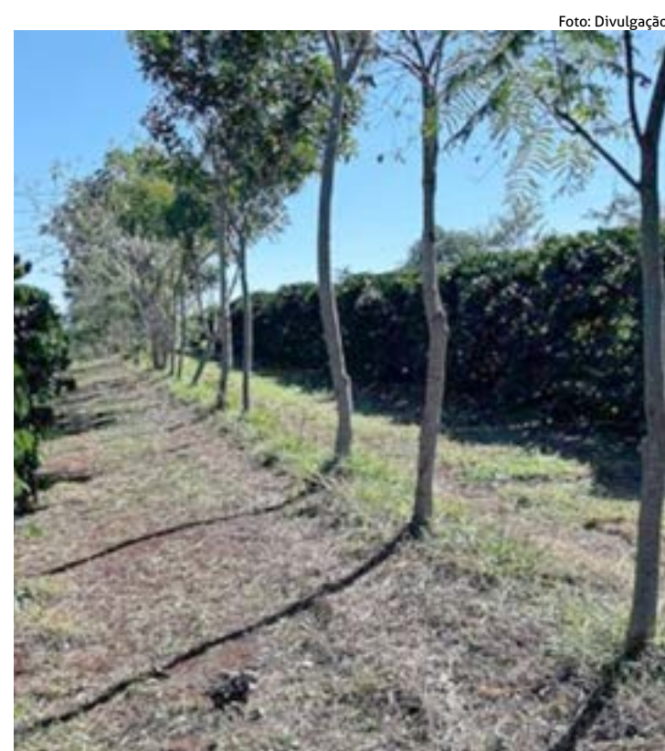
PROJETO de cafeicultura regenerativa conecta cooperados, ciência e mercado internacional e posiciona a Cooxupé como referência em sustentabilidade no café

Rede de Notícias do Sindijori MG www.sindijoring.com.br