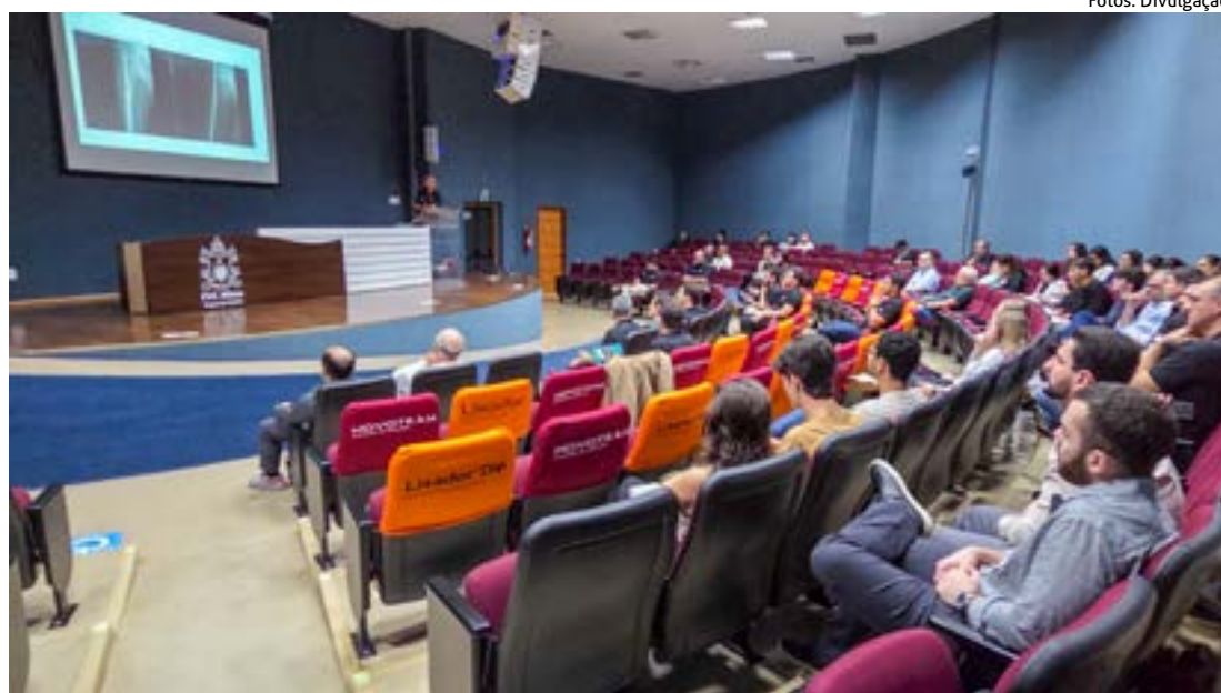
NO SÁBADO (11), a programação seguiu com a parte teórica, realizada na PUC Minas - Poços de Caldas, reunindo médicos, especialistas e profissionais da área

“Essa 5ª Jornada do Quadril veio mudar a vida de oito pacientes que foram submetidos à artroplastia total de quadril. Pacientes do SUS que estavam sofrendo com dor e limitação funcional. Graças a Deus e ao apoio das empresas parceiras, foi possível realizar essas cirurgias”, destacou.