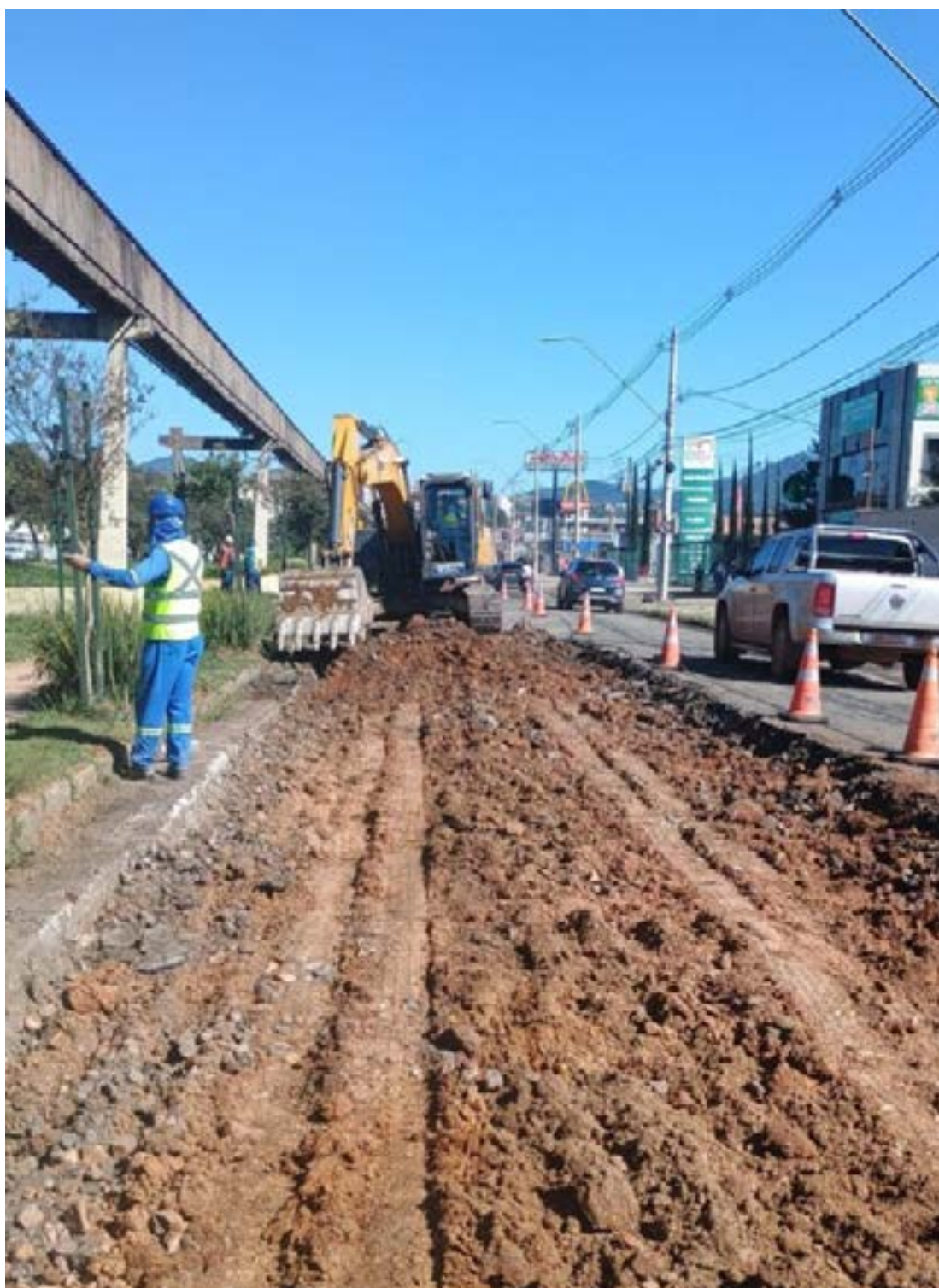
PRIMEIRA fase das obras na João Pinheiro deve durar cerca de seis meses

final para iniciar o asfaltamento ainda nesta semana ou no início da próxima.