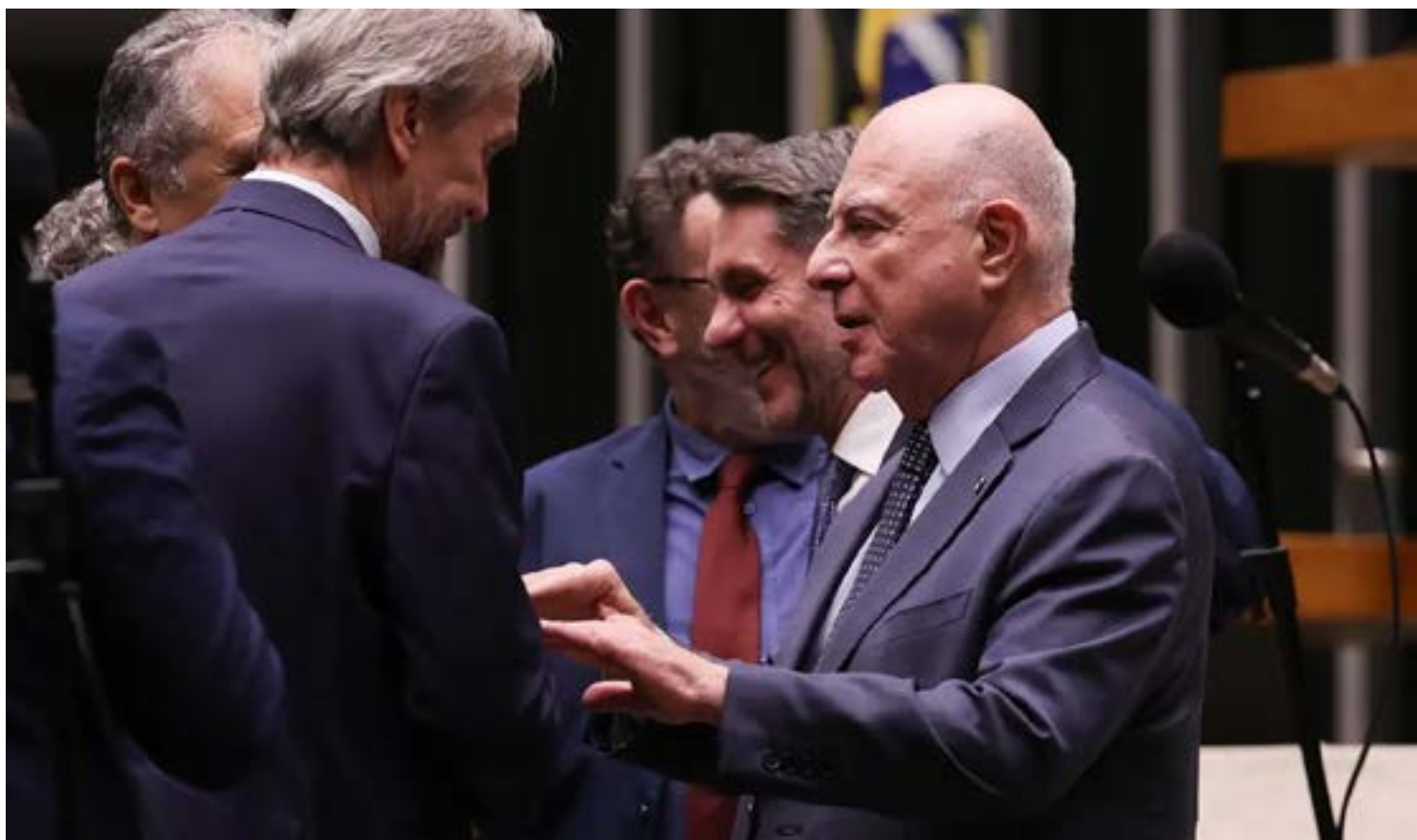
PROJETO de lei prevê a criação de um comitê para analisar o setor

“É preciso que a soberania nacional e os inte-